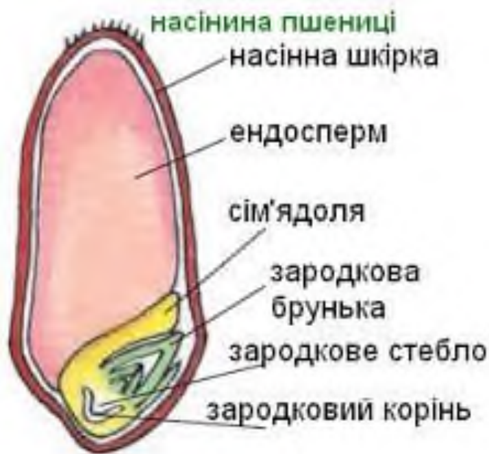
Рис.2. Будова насінини пшениці

Таким чином, із заплідненої диплоїдної яйцеклітини формується зародок насінини, а із вторинної триплоїдної клітини – поживна тканина (ендосперм), покриви насінного зачатка перетворюються в покриви насінини, а стінка зав'язі, розростаючись, утворюють оплодень.